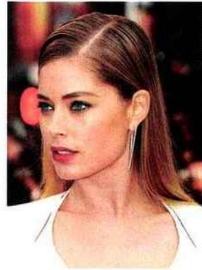
Plaqué sexy pour DOUTZEN KROES.