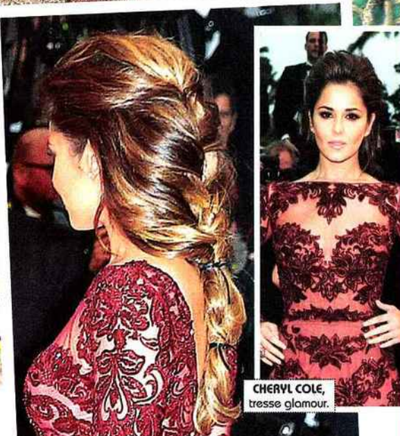
CHERYL COLE, tresse glamour.