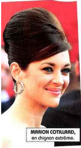
MARION COTILLARD, en dignon extrême.