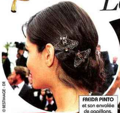
FREIDA PINTO et son envolée de papillons.